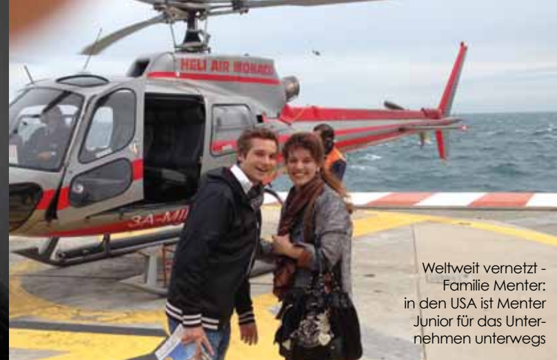
Weltweit vernetzt - Familie Menter: in den USA ist Menter Junior für das Unternehmen unterwegs